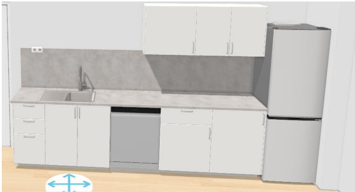
Rysunek 1 Wygląd zestawu